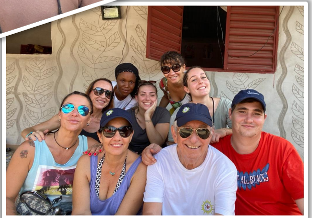
L'équipe de bénévoles de la mission 3

Nous espérons que la situation sanitaire va enfin s'arranger et reprendre le rythme de nos missions.