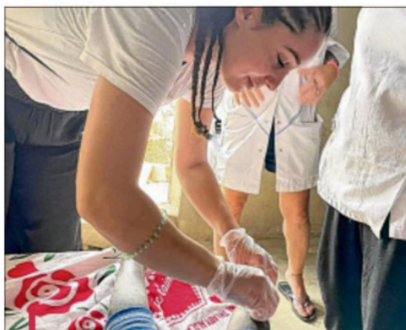
Les infirmières ont pu soigner de nombreux habitants dans la case maternité à Santiaba - commune de Diouloulou.

La cagnotte : leetchi.com/c/lumieres-denfants-a-santiaba . Toutes les informations sur : lumieresdenfants.org .